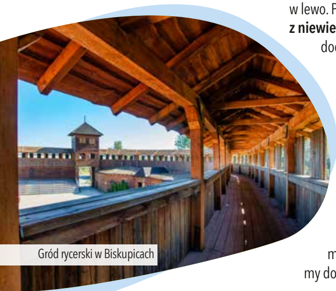
Gród rycerski w Biskupicach

docieramy do Proślic , gdzie mijamy zabytkowy drewniany kościół Najświętszego Serca Pana Jezusa . Za kościołem dojeżdżamy do skrzyżowania i skręcamy w lewo. Po chwili mijamy dawny pałac z niewielkim parkiem . Za Proślicami docieramy do Jakubowic . Główna droga na początku wioski skręca w prawo, a my skręcamy w lewo, by zobaczyć drewniany kościół Matki Boskiej Królowej Polski . Przy cmentarzu skręcamy w prawo, mijamy kościół i dojeżdżamy do asfaltowej drogi. Skręcamy w prawo, na następnym skrzyżowaniu jedziemy prosto i 500 m dalej dojeżdżamy do głównej drogi. Skręcamy w lewo,