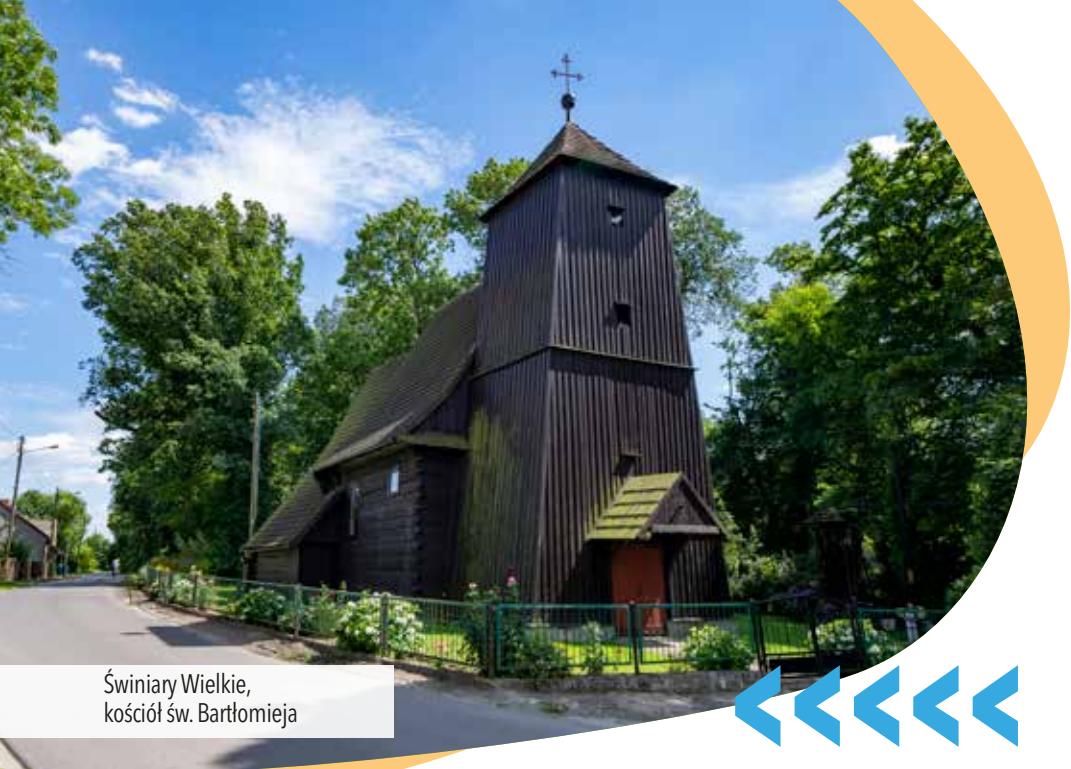
Świniary Wielkie, kościół św. Bartłomieja