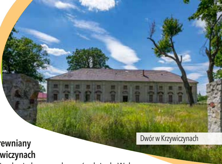
Dwór w Krzywiczynach

mijamy całe Jakubowice i po chwili przejeżdżamy przez Bruny . Za Brunami dojeżdżamy do skrzyżowania z drogą Wołczyn – Kępno , na którym skręcamy w lewo i jedziemy dalej czarnym szlakiem . Po chwili przejeżdżamy przez Krzywiczyny , gdzie stoi drewniany kościół św. Trójcy . W Krzywiczynach możemy skrócić naszą wycieczkę, jadąc cały czas prosto drogą główną i wracając