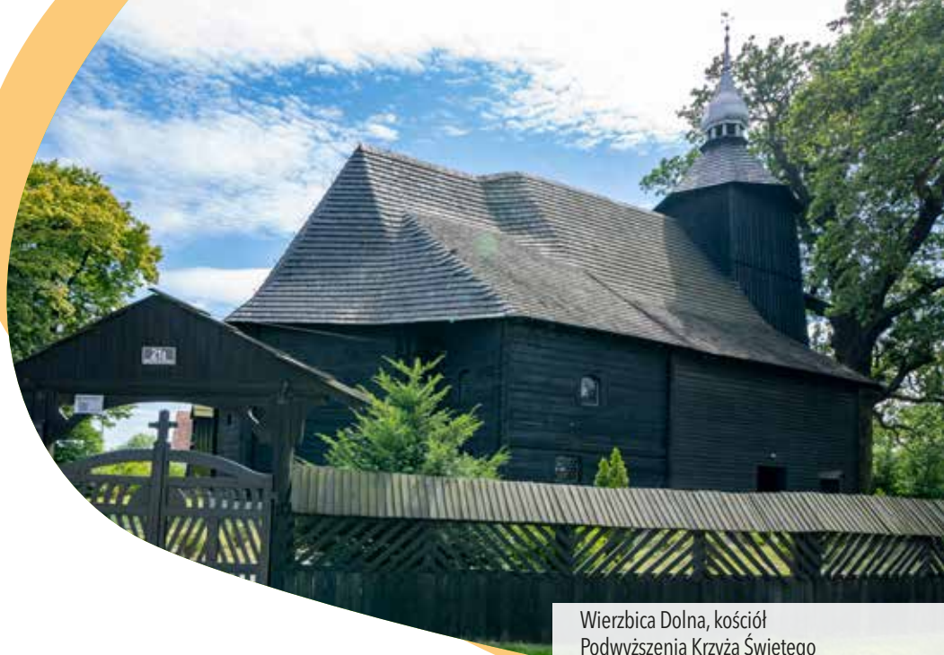
Wierzbitca Dolna, kościół Podwyższenia Krzyża Świętego