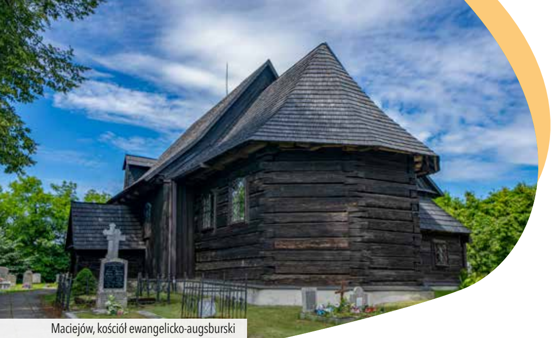
Maciejów, kościół ewangelicko-augsburski

nych Ślązaków, księdza Jana Dzierżonia. Jak wiadomo, był on zapalonym pszczelarzem. Na zachodnim krańcu wioski do dziś stoi dworek, w którym spędził on ostatnie lata swojego życia. Tuż obok, na terenie dawnej posiadłości księdza utworzono w 1970 r. pasiekę zarodową, która funkcjonuje do dziś, dostarczając pszczelarzom wciąż nowe pokolenia pszczelich matek.