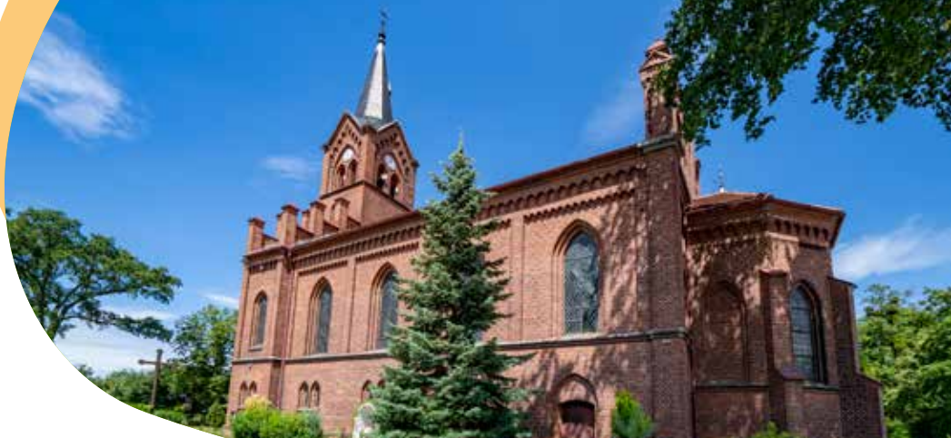
Smardz Górne, kościół Podwyższenia Krzyża Świętego

neogotycki ołtarz oraz gotycki dzwon z 1514 r. Wokół kościoła rozciąga się teren po dawnym cmentarzu.