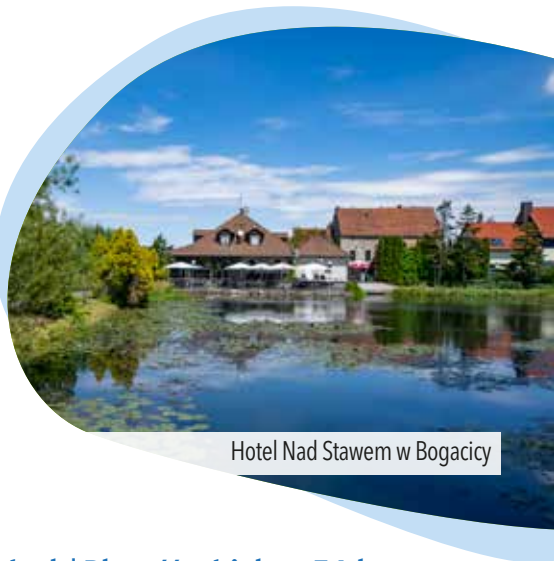
Hotel Nad Stawem w Bogacicy

nr 42 . Poruszamy się mało uczęszczaną szosą przez Czaple Wolne i docieramy do Bogacicy . Jedziemy prosto drogą obok wioski i na jej końcu skręcamy w lewo, w ul. Wolności , opuszczając żółty szlak rowerowy. Mijamy cmientarz i docieramy do kościółki Trójcy Świętej .