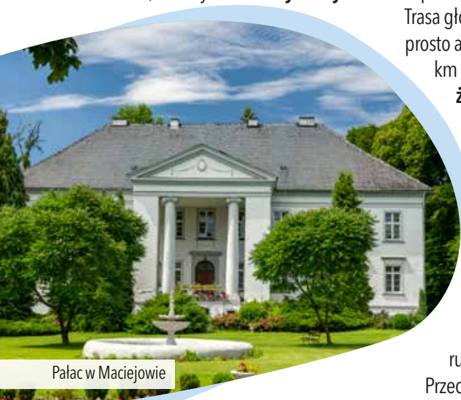
Pałac w Maciejowie

kościół Nawiedzenia Najświętszej Marii Panny . W tym celu trzeba skręcić w prawo i dojechać do centrum wioski. Trasa główna wycieczki omija je, biegnąc prosto asfaltową szosą do Krzywizny (2,5 km dalej). Od tej pory poruszamy się żółtym szlakiem rowerowym , który towarzyszyć nam będzie aż do Bogacicy . W Krzywiznie przejeżdżamy przez tory kolejowe i na rozwidleniu za nimi jedziemy prosto ul. Witosa . Na następnym rozwidleniu jedziemy w prawo i docieramy do kościółki Matki Boskiej Częstochowskiej stojącego przy ruchliwej drodze krajowej nr 11 . Przechodzimy ostrożnie na drugą stronę