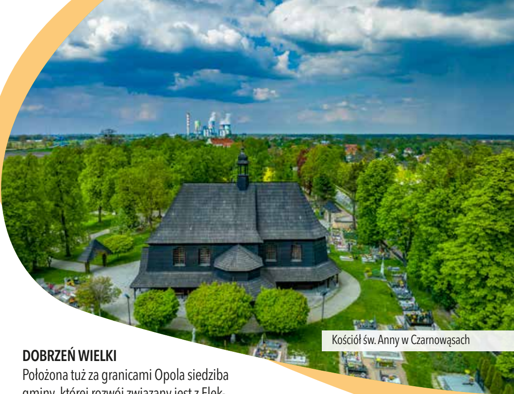
Kościół św. Anny w Czarnowąsach