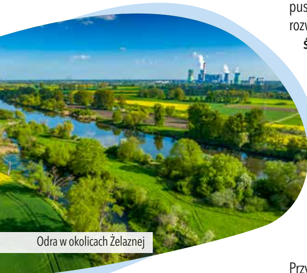
Odra w okolicach Żelaznej

Wielkim . My jedziemy w lewo i docieramy do wału nad Odrą , gdzie kończy się asfalt. Dalej jedziemy szeroką, polną drogą między wijącą się pięknie Odrą , a łąki sielankowymi (zwłaszcza wiosną) łąkami i pastwiskami. Nie zdziwcie się, jeśli przy pobliskich gospodarstwach drogę zagrozi Wam kogut, przebiegnie kilka świnek lub powoli przetoczy się krowa. Przy zakolu Odry wjeżdżamy na krótko na trawiasty wał i dojeżdżamy do asfaltowej