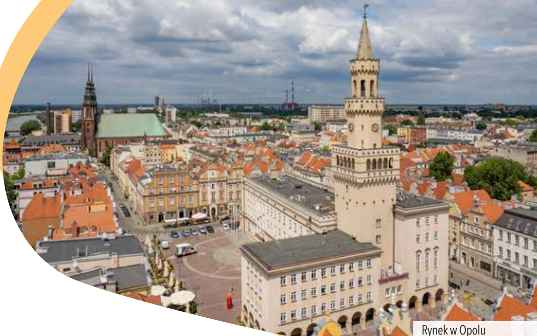
Rynek w Opolu