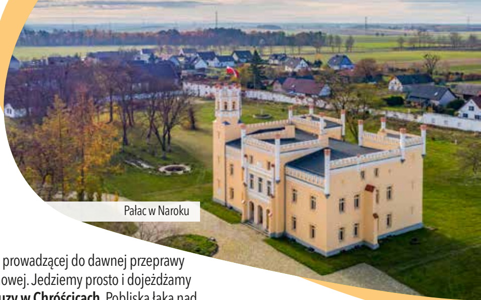
Pałac w Naroku

szosy prowadzącej do dawnej przeprawy promowej. Jedziemy prosto i dojeżdżamy do śluzy w Chróścicach . Pobliska łąka nad rzeką to idealne miejsce na odpoczynek i krótki piknik. Tutaj możemy skrócić naszą wycieczkę , przechodząc mostem nad śluzą i wracając do Opola przez Dobrzeń Wielki i Czarnowąs (całkowita długość trasy – 36,2 km). Możemy też ją nieznacznie wydłużyć , jadąc do Naroka , gdzie warto zobaczyć ciekawy pałac (4 km w obie