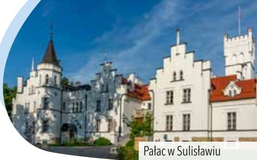
Pałac w Sulisławiu

camy za nim w prawo, w kierunku Gałązyczyc , by zaraz potem skręcić w pierwszą w lewo polną drogę. Po chwili dojeżdżamy na skraj lasu, gdzie na drugim rozwidleniu jedziemy w prawo i wjeżdżamy w głąb lasu. Po kilku zakrętach dojeżdżamy do rozwidlenia, na którym skręcamy w lewo zgodnie z tablicami kierującymi do pałacu w Sulisławiu . Jedziemy długą prostą przez las i na drugim leśnym skrzyżowaniu skręcamy w prawo. Kilometr dalej wyjeżdżamy z lasu do Sulisławia . Jedziemy wzdłuż ogrodzonego terenu pałacu w Sulisławiu i na końcu drogi skręcamy w prawo, jadąc do wejścia głównego na teren kompleksu pałacowego. Po przeciwnej stronie drogi zaczyna się ścieżka prowadząca nad stawy i kąpielisko . Wyjeżdżając z terenu pałacu, za bramą skręcamy w lewo. Czeka nas teraz przyjemny zjazd. Kilometr za Sulisławiem dojeżdżamy z powrotem do drogi rowerowej po śladzie dawnej linii kolejowej i skręcamy w lewo. Jedziemy drogą dla rowerów do końca i dalej szosą samochodową do skrzyżowania z obwodnicą Grodkowa . Przecinamy ją prosto bardzo ostrożnie i jadąc dalej ul. Otmuchowską , a później ul. Warszawską , wracamy do grodkowskiego Rynku , gdzie kończymy wycieczkę.