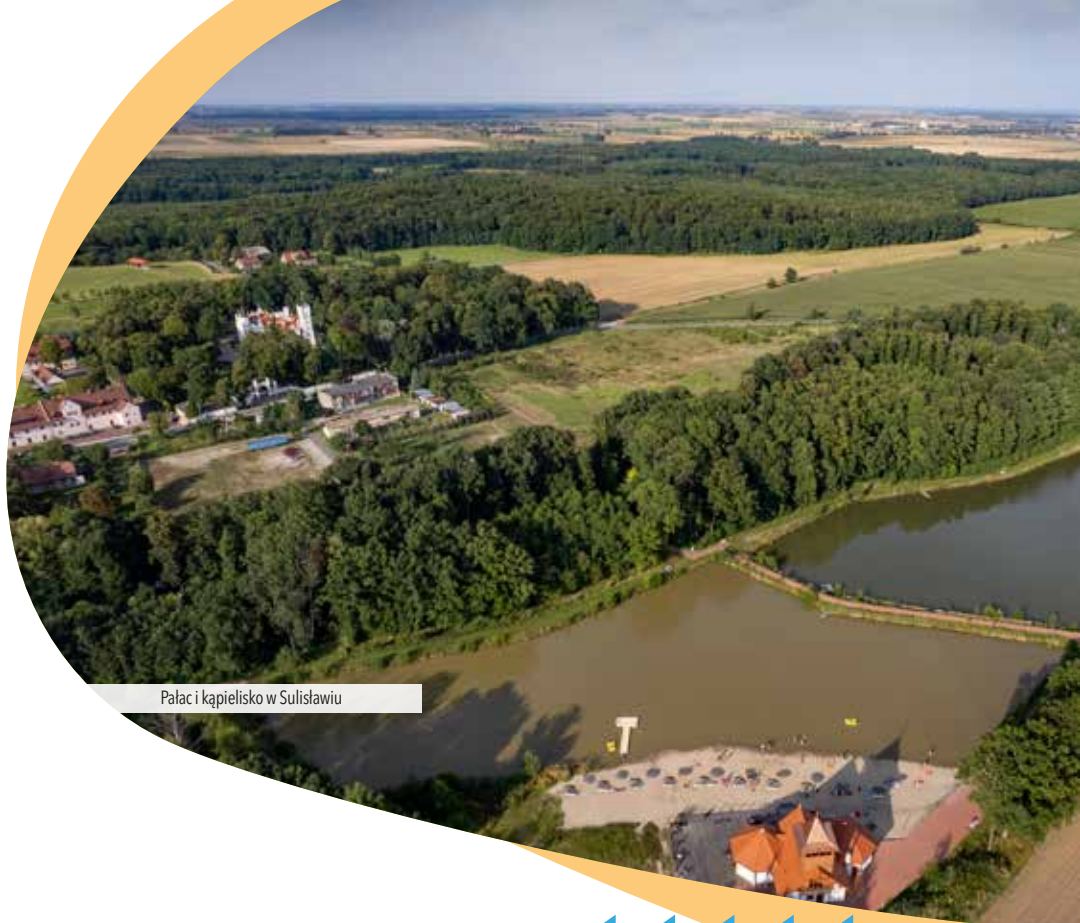
Pałac i kąpielisko w Sulisławiu

uwagę zasługują: klasycystyczny ołtarz z płaskorzeźbami przedstawiającymi ukrzyżowanie i zmartwychwstanie Chrystusa, ambona z 1800 r. oraz barokowy krucyfiks. Kościół otoczony jest starym murem zbudowanym z rudy darniowej.