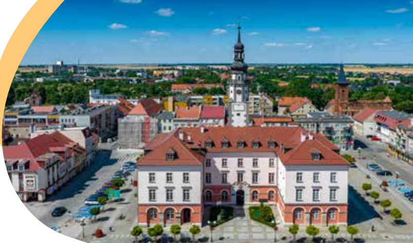
Rynek w Grodkowie