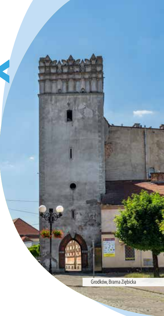
Grodków, Brama Ziębicka

Jedno z najstarszych miast Opolszczyzny, którego powstanie datuje się na 1234 r. W 1258 r. Grodków uzyskał prawa miejskie. Od połowy XIV w. miasto stało się częścią biskupiego księstwa nyskiego i było wówczas znaczącym ośrodkiem rzemieślniczym, rolniczym i handlowym. W 1449 r. zdarzył się w Grodkowie tragiczny pożar, który zniszczył całą zabudowę miasta. Nie była to ostatnia katastrofa tego typu. Kolejne pożary i zniszczenia miały miejsce w XVI w. (kilkukrotnie) oraz w 1883 r. Również II wojna światowa spowodowała zniszczenie miasta w ponad 60%. Pomimo tak licznych katastrof w Grodkowie w stosunkowo dobrym stanie zachowało się stare miasto, a także kilka zabytkowych budowli. W sercu miasta, na Rynku stoi zabytkowy ratusz z 1840 r. Nieopodal przy ul. Warszawskiej wznosi się okazały gotycki kościół św. Michała Archanioła. Po drugiej stronie starego miasta znajdują dobrze zachowane ruiny kolejnego dużego kościoła, który niegdyś należał do ewangelików. W Grodkowie zachowała się także synagoga oraz częściowo mury miejskie. Dość unikatową budowlą jest zabytkowy wiatrak hollenderski stojący na południe od starówki, przy ul. Krakowskiej.