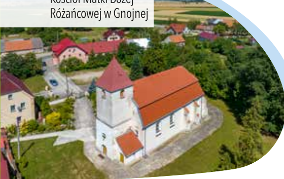
Kościół Matki Bożej Różańcowej w Gnojnej

W Rożnowie na rozwidleniu dróg przy wjeździe do wioski skręcamy w prawo, na brukowaną drogę . Za wioską zaczyna się mocno terenowy odcinek, po przejechaniu którego dojeżdżamy do Jesz kotła , malowniczo położonego w dolinie przeplatanej pagórkami. Na rozwidleniu przed wioską skręcamy w prawo, na kolejnym w lewo i po chwili wjeżdżamy na główną drogę, jadąc dalej prosto. Po drodze mijamy niepozorny kościół z kuriozalnym obeliskiem poświęconym armii radzieckiej znajdującym tuż przy nim. Za przystankiem autobusowym skręcamy w prawo i jedziemy cały czas prosto w kierunku Gnojnej . Po drodze czeka nas pierwszy odcinek leśny podczas tej wycieczki. To najładniejszy fragment trasy, na którym droga wiję się zakrętami raz pod górę, to znów w dół. Za lasem docieramy do Gnojnej . Jedziemy asfaltową drogą do końca i skręcamy w prawo, wjeżdżając na drogę wojewódzką nr 378 . Mijamy zabytkowy kościół Matki Boskiej Różańcowej i skrę-