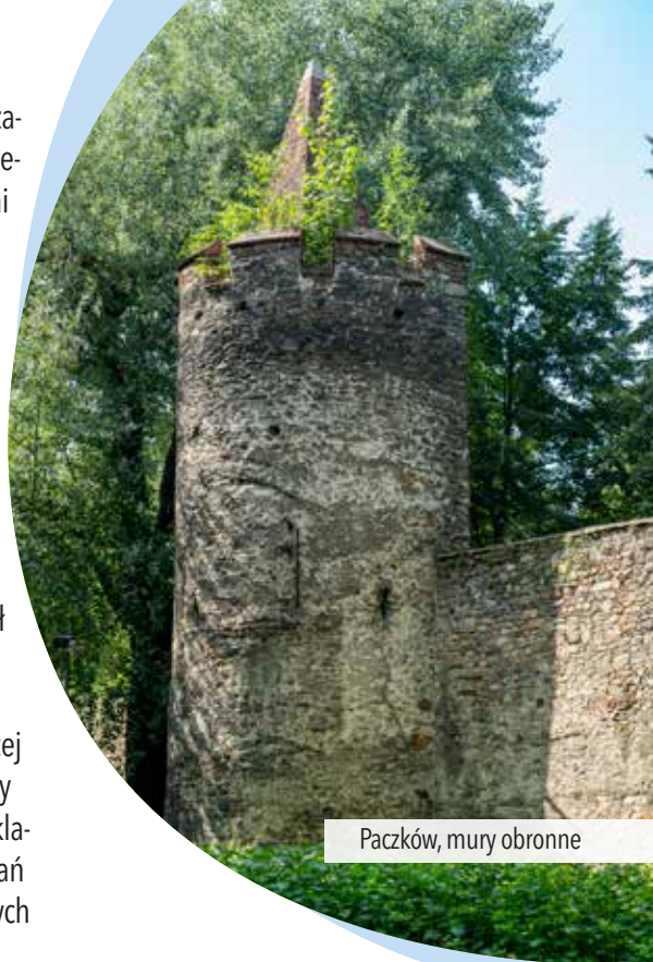
Paczków, mury obronne

Paczków posiada jedno z najlepiej zachowanych fortyfikacji miejskich w Polsce. To dzięki nim uzyskał przydomek polskiego Carcasonne. Większość z nich powstawała pomiędzy XIV a XVI w. W obrębie paczkowskich murów obronnych znajduje się 19 baszt łupinowych oraz 3 wieże przy bramach: Wrocławskiej, Ziębickiej oraz Kłodzkiej. Czwarta Brama Nyska wieży nie posiadała. Wieża Bramy Wrocławskiej to obecnie doskonały punkt widokowy, a z jej wierzchołka podziwiać można Jezioro Otmuchowskie, Zalew Paczkowski oraz okoliczne góry.