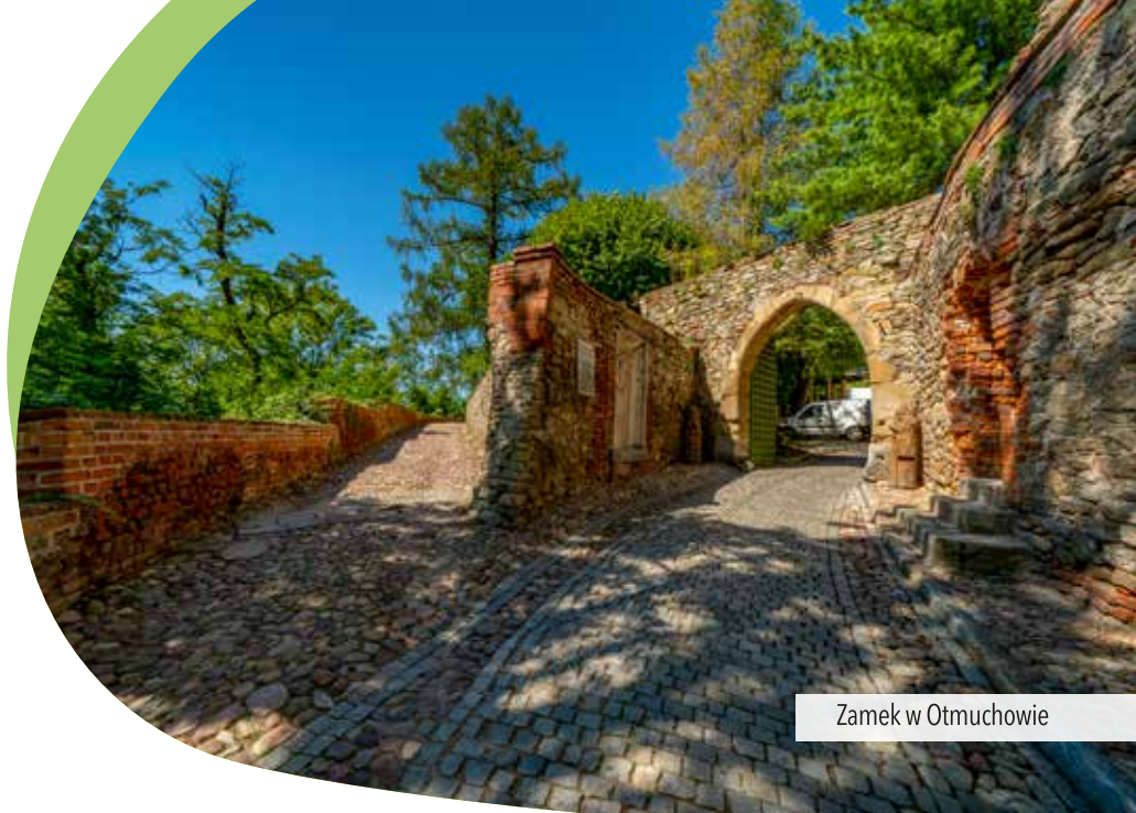
Zamek w Otmuchowie

i rzemieślników swojej epoki. Pochodzili oni głównie z Niemiec i Włoch. We wnętrzu warto zwrócić również uwagę na piękne i cenne przykłady barokowego malarstwa, które w świetnym stanie zachowały się do dziś.