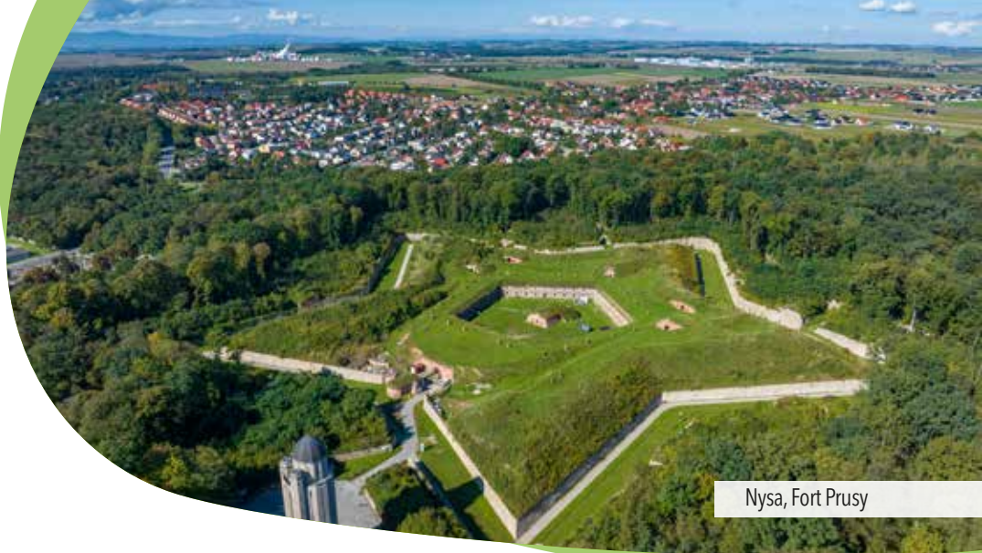
Nysa, Fort Prusy