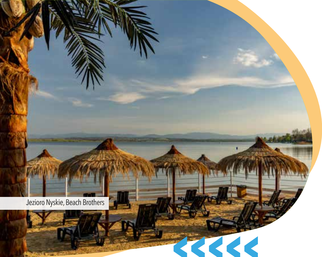
Jezioro Nyskie, Beach Brothers