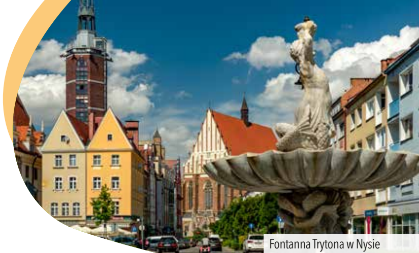
Fontanna Trytona w Nysie