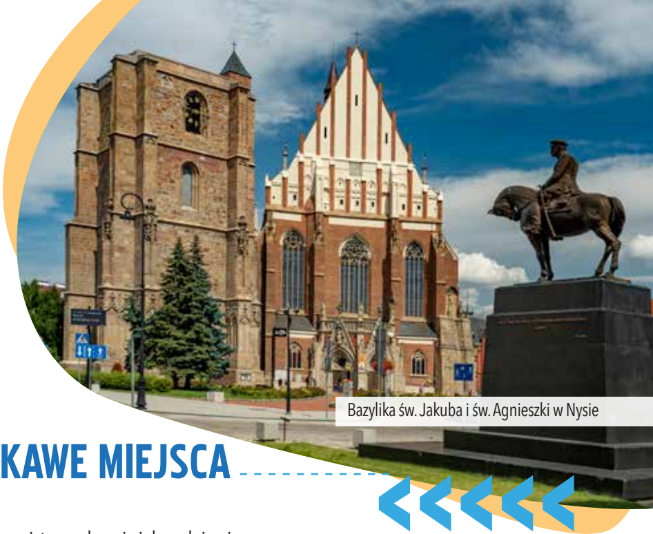
Bazylika św. Jakuba i św. Agnieszki w Nysie