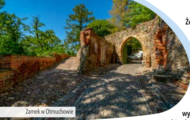
Zamek w Otmuchowie

otmuchowskie pagórki z lewej strony i całe pasmo Jeseników i Gór Opawskich z prawej. Jedziemy przez centrum wioski, gdzie z powrotem dołącza do nas oznaczony na niebiesko Szlak Kopernikowski . Za wioską mijamy z prawej strony kopalnię piasku i jedziemy dalej szeroką drogą szutrową, która raz opada, to znów wspina się pośród pól. Niecały kilometr dalej w prawo odbija droga prowadząca nad klif nad jeziorem , przy którym znajduje się niewielka plaża . Jadąc dalej, docieramy do pełnego infrastruktury turystycznej Głębinowa . Przy pierwszych zabudowaniach warto skrócić na chwilę w prawo, zjeżdżając stromą drogą do Błękitnej Zatoki z przepięknym widokiem na Góry Opawskie . Trzymając się niebieskiego szlaku rowerowego , jedziemy główną ulicą Głębinowa . Przy centralnym placu stoi malowniczo położony kościół – sanktuarium św. Rity . Zaraz za nim znajduje się rozległy taras z widokiem na jezioro . Jedziemy wzdłuż brzegu jeziora i po chwili docieramy do wąskiej furtki Klubu