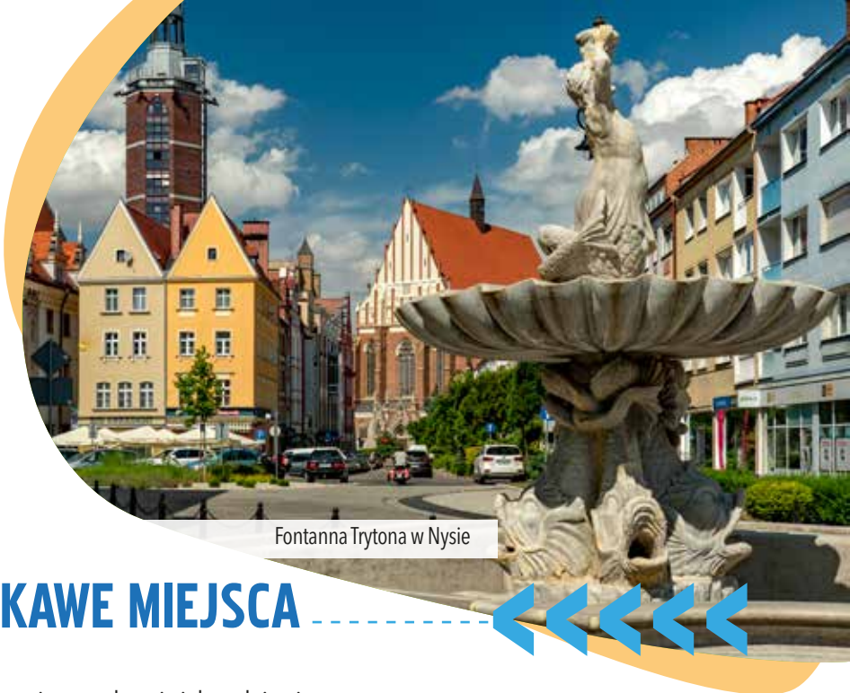
Fontanna Trytona w Nysie