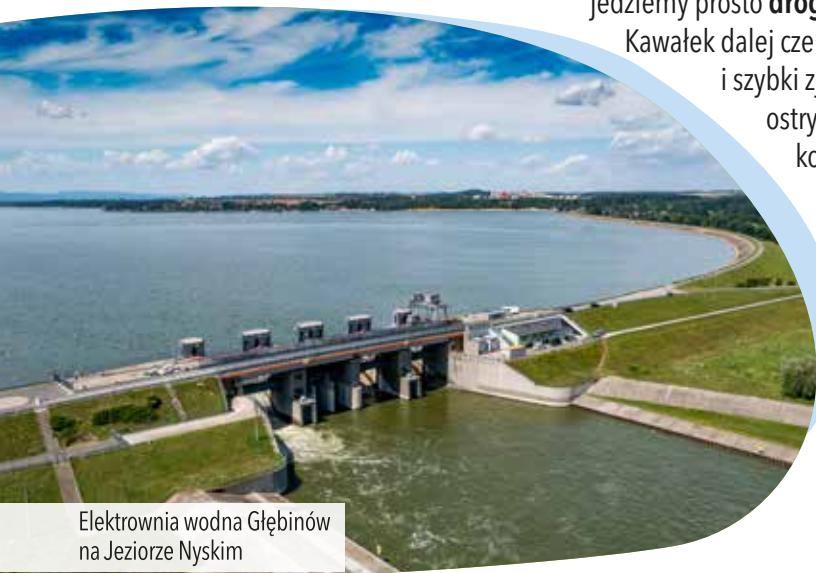
Elektrownia wodna Głębiniów na Jeziorze Nyskim

Kawałek dalej czeka nas przyjemny i szybki zjazd zakończony ostrym zakrętem. Na końcu zagajnika dojeżdżamy do asfaltowej drogi, skręcamy w lewo i docieramy ponownie do Łączek , przez które jechaliśmy w pierwszej części wycieczki.