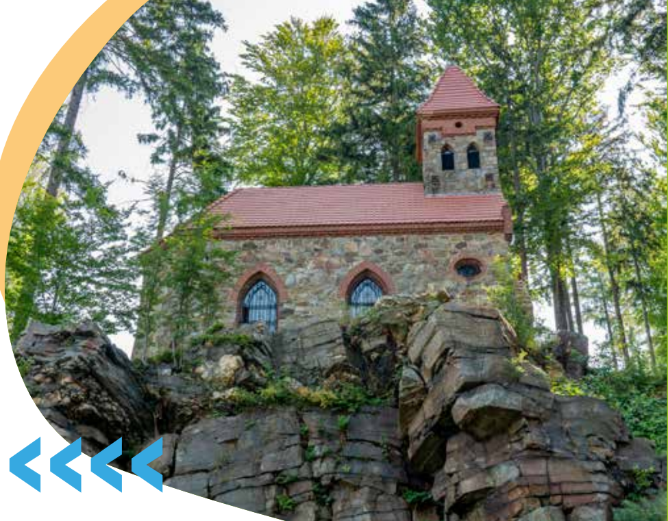
Głucholazy, Góra Chrobrego

przedniej romańsko-gotyckiej świątyni. We wnętrzu największe wrażenie robią barokowe ołtarze – główny i 8 bocznych. W jednym z nich umieszczony jest cenny obraz z końca XVII w. pt. „Opłakiwanie Jezusa”. To kopia obrazu znanego malarza flamandzkiego Antoona van Dyska, która powstała w pracowni Michaela Willmana.