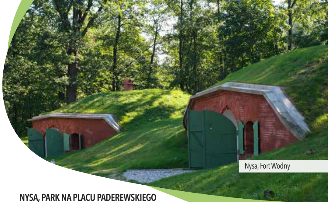
Nysa, Fort Wodny