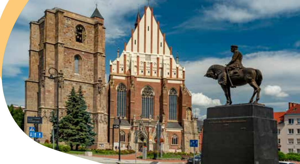
Bazylika św. Jakuba i św. Agnieszki w Nysie

➤➤➤ 40,3 km • Łączki – Nysa Długość odcinka – 14,0 km