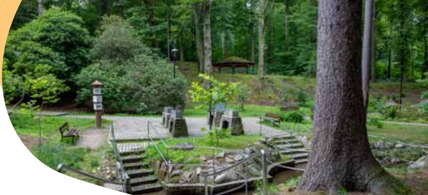
Park Zdrojowy w Głuchołazach