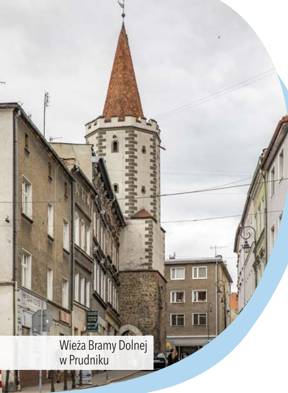
Wieża Bramy Dolnej w Prudniku

zakręca w prawo, a my jedziemy prosto wąską ścieżką, którą poprowadzony jest niebieski szlak rowerowy oraz pieszy Główny Szlak Sudecki oznaczony na czerwono . Wyjeżdżamy na skraj lasu, gdzie skręcamy w prawo. Po lewej stronie widzimy wzniesienia czeskiej części Gór Opawskich . Na kolejnym skrzyżowaniu rozdzielają się szlaki turystyczne. Pieszy, czerwony biegnie prosto, a my skręcamy w lewo wraz z niebieskim szlakiem rowerowym . Czeka nas kilometr dość wyboistej drogi, po którym dojeżdżamy do rozdroża pod Trzebiną ze stojącym na nim krzyżem . Tu skręcamy w prawo i jedziemy drogą utwardzoną kamieniem. Po chwili