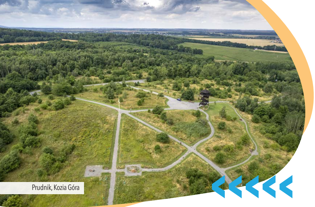
Prudnik, Kozia Góra