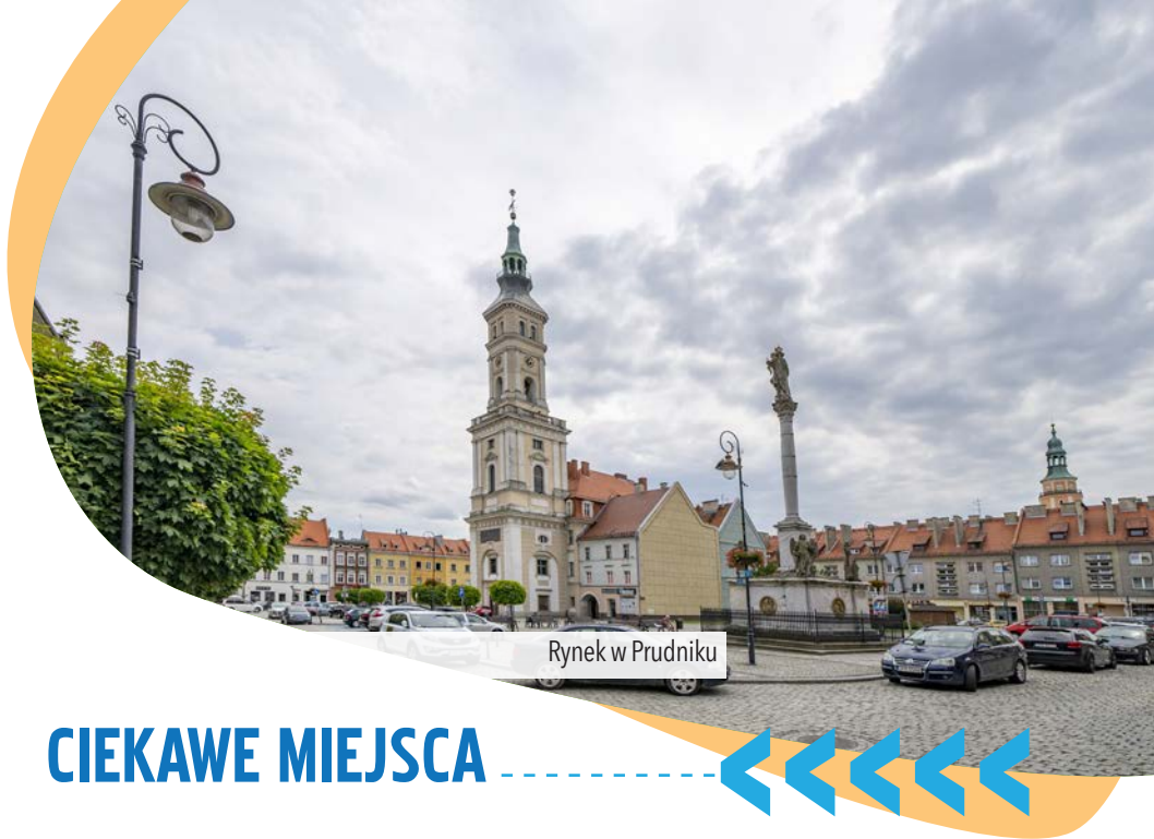
Rynek w Prudniku