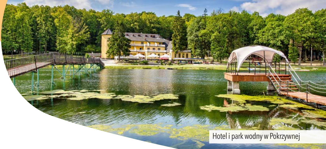
Hotel i park wodny w Pokrzywniej

i wjeżdżamy na asfaltową szosę. Po chwili docieramy do skrzyżowania w pobliżu kościółka Podwyższenia Świętego Krzyża w Moszczance i skręcamy w lewo.