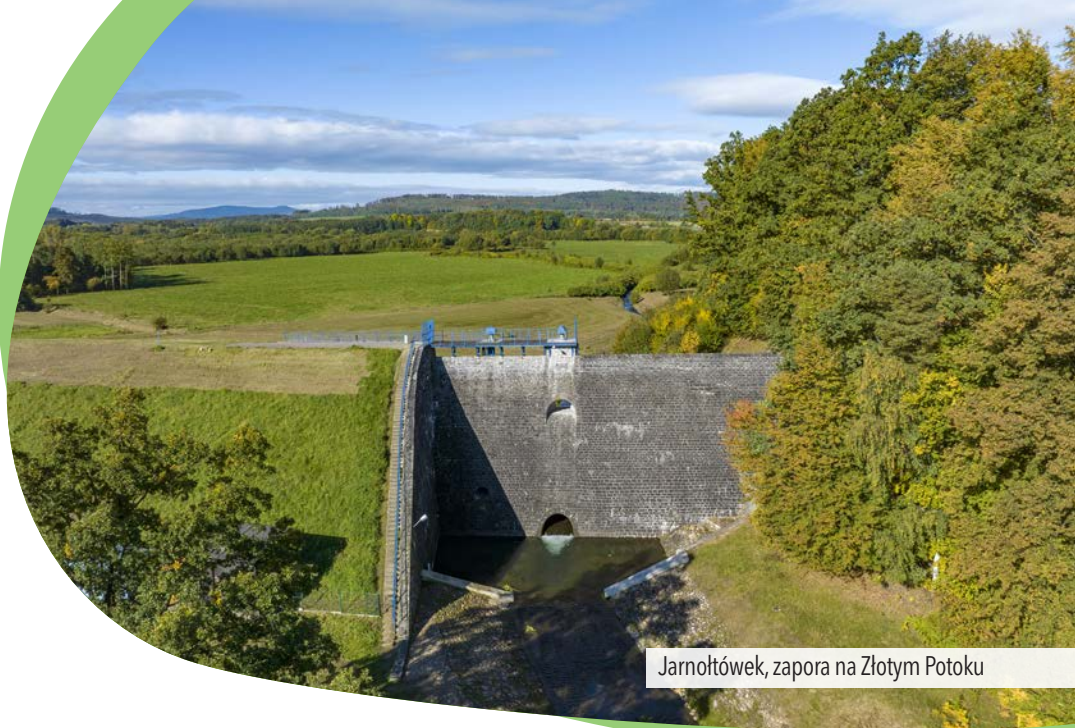
Jarnołtówek, zapora na Złotym Potoku

zabytkowa wieża widokowa z 1890 r. Działa w niej punkt gastronomiczny z zimnymi napojami i przekąskami. Nieznacznie poniżej szczytu, po polskiej stronie funkcjonuje schronisko, w którym można przenocować i zjeść obiad. Tereny wokół Biskupiej Kopy pokryte są wieloma popularnymi szlakami pieszymi i rowerowymi.