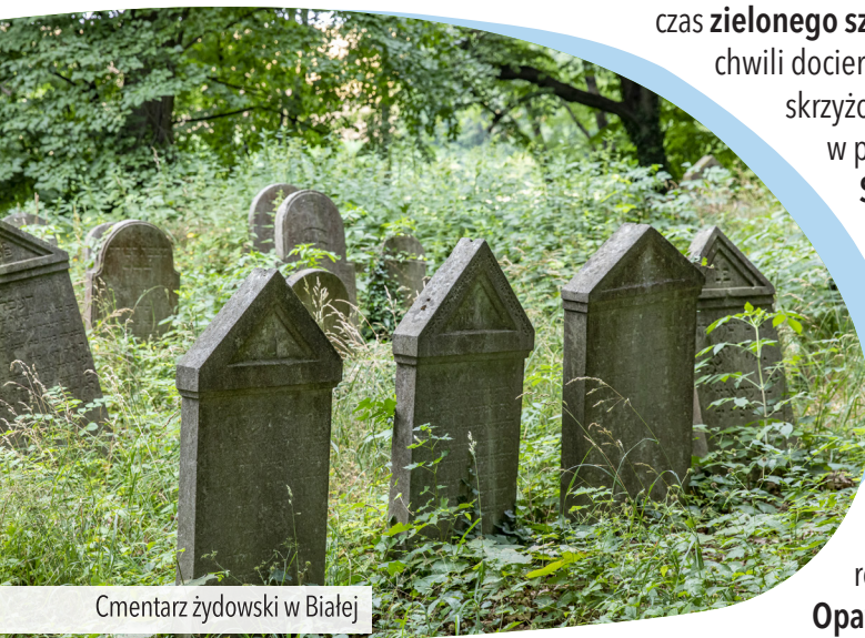
Cmentarz żydowski w Białej

wic , na które składa się zaledwie kilka domów. Tu kończy się asfalt i zaczyna droga szutrowa. Na rozwidleniu dróg za osadą skręcamy w prawo. Po chwili wyjeżdżamy z lasu i jadąc prosto na następnym skrzyżowaniu, mijamy bokiem Nową Wieś Prudnicką . Za wioską zaczynają się pierwsze pagórki. Trzymając się cały czas zielonego szlaku rowerowego , po chwili docieramy do Gostonii . Na skrzyżowaniu za nią skręcamy w prawo i wjeżdżamy do Solca . W centrum wioski, tuż za kościołem skręcamy w lewo. Na następnym skrzyżowaniu jedziemy prosto, opuszczając szlak zielony i wjeżdżając na czerwony . Przed sobą widzimy rozległą panoramę Gór Opawskich .