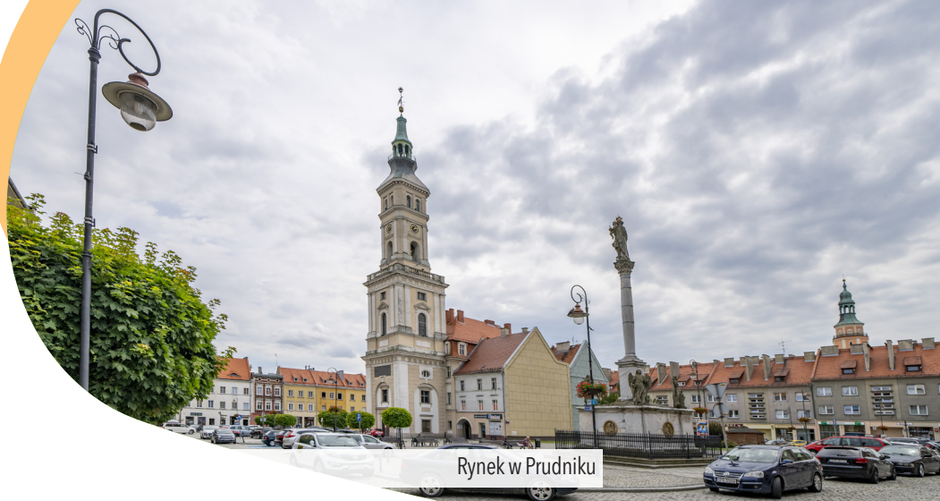
Rynek w Prudniku