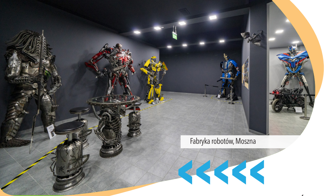
Fabryka robotów, Moszna