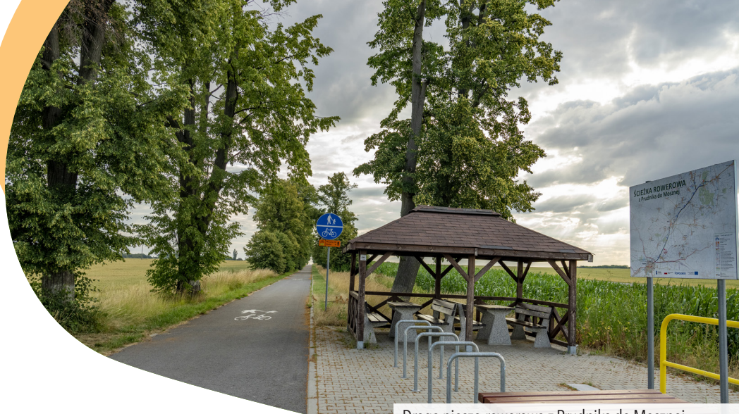
Droga pieszo-rowerowa z Prudnika do Mosznej

2 km dalej, po kilku zjazdach i podjazdach dojeżdżamy do Olbrachcic . Tu skręcamy w lewo i zaraz potem w prawo. Za wioską opuszcza nas czerwony szlak rowerowy, a my jadąc prosto, docieramy do Słokowa . Przejeżdżamy główną drogą przez całą wioskę i na rozwidleniu za nią skręcamy w prawo. Po chwili przejeżdżamy przez Olszynkę , gdzie na rozwidleniu dróg skręcamy w prawo i poruszamy się dalej zielonym szlakiem rowerowym . Na kolejnym rozwidleniu jedziemy prosto. Po chwili droga zakręca w prawo i w lewo, kończy się asfalt i wyjeżdżamy na pola i pagórki pomiędzy Olszynką a Lubrzą. Ten odcinek jest dość wyboisty i może być trochę niewygodny dla posiadaczy rowerów rekreacyjnych i turystycznych. Po kilku zakrętach, 3 km za Olszynką dojeżdżamy do drogi krajowej nr 40 . Tu zmuszeni jesteśmy przejechać