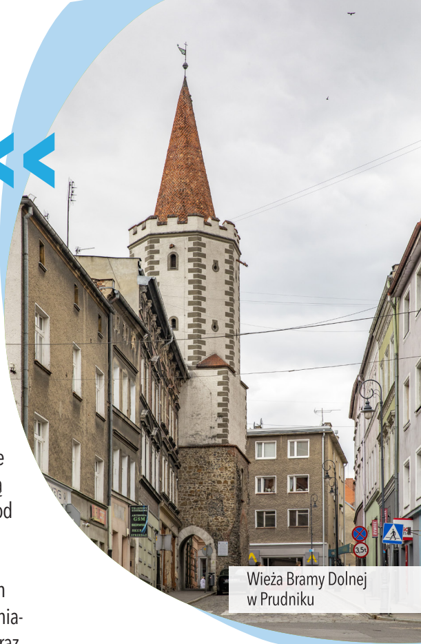
Wieża Bramy Dolnej w Prudniku

Zabytkowa, późnobarokowa świątynia zbudowana w latach 1730-1738. Jej pierwowzorem był kościół św. Mikołaja na Malej