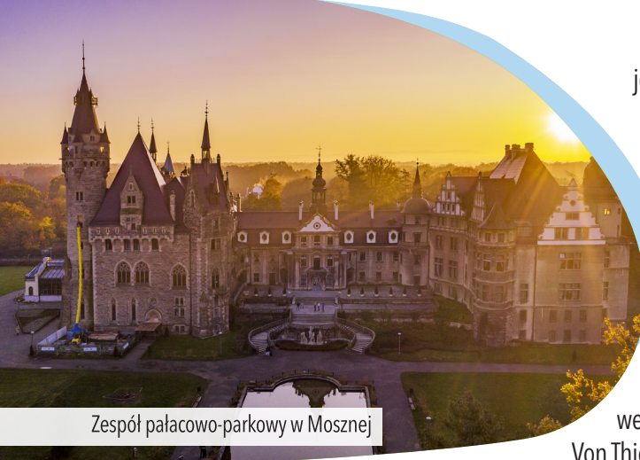
Zespół pałacowo-parkowy w Mosznej

infrastruktura w postaci punktu odpoczynkowego z wiatą turystyczną i ławkami.