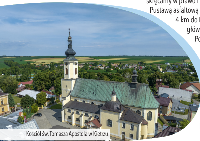
Kościół św. Tomasza Apostoła w Kietrze

Po chwili przejeżdżamy przez rzeczkę Troję i na skrzyżowaniu za nią jedziemy prosto, wjeżdżając na główny plac Kietrza , na którym możemy odpuścić przed drogą powrotną.