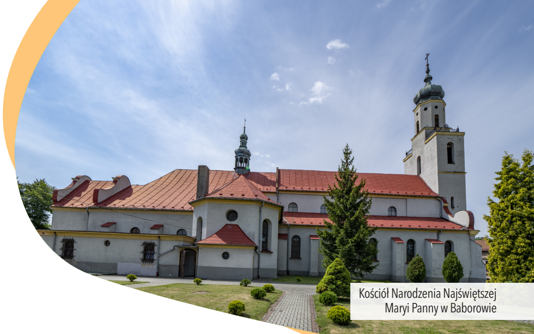
Kościół Narodzenia Najświętszej Maryi Panny w Baborowie