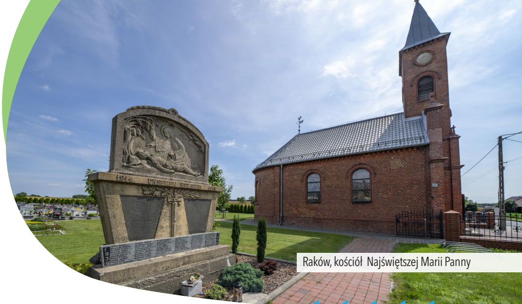
Raków, kościół Najświętszej Marii Panny