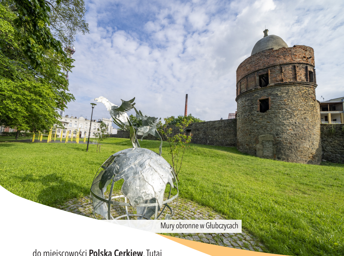
Mury obronne w Głubczycach

do miejscowości Polska Cerkiew . Tutaj w centrum wioski droga główna zakręca w prawo, a my jedziemy w lewo, w ul. Rogożańską . Mijamy szkołę i po chwili opuszczamy wioskę. Niecały kilometr dalej przejeżdżamy skrajem wioski Rogożany , gdzie droga zakręca łagodnie w prawo. 2,5 km dalej dojeżdżamy do Wojnowic . W centrum wioski, w pewnym oddaleniu od naszej trasy znajdują się malownicze ruiny starego kościoła . W Wojnowicach jedziemy cały czas prosto i wyjeżdżamy z wioski ul. Kietrzańska . Nasza droga biegnie wzdłuż rzeczki Troja i dociera do Włodzienina . Poruszamy się cały czas główną ulicą. 400 m za kościołem dojeżdżamy do skrzyżowania, na którym skręcamy w prawo. Jedziemy