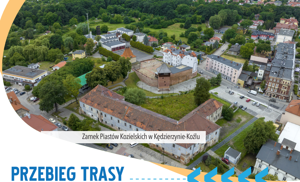
Zamek Piastów Kozielskich w Kędzierzynie-Koźle