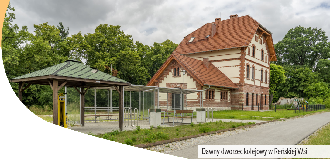
Dawny dworzec kolejowy w Reńskiej Wsi

Jedziemy dalej prosto parkową alejką , która szerokim łukiem zakręca w lewo, wzdłuż północnego fragmentu Plant . Jadąc wzdłuż Odry , docieramy do mostu Józefa Długosza . Tu osoby zaczynające trasę w Kędzierzynie skręcają w prawo i wracają do Kędzierzyna , a pozostali