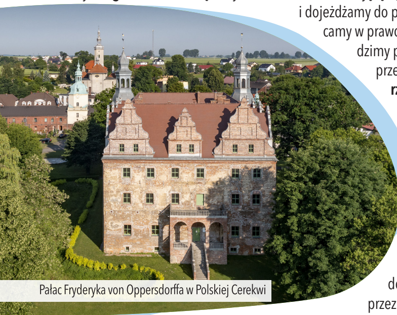
Pałac Fryderyka von Oppersdorffa w Polskiej Cerekwi

w prawo przed niewielkim mostkiem . Jedziemy teraz krótki odcinek równą, szutrową drogą i docieramy do Dębowej . W centrum wioski na rozwidleniu skręcamy w prawo i jedziemy cały czas drogą główną z jej licznymi zakrętami. Kilometr za wioską dojeżdżamy do akwenu Dębowa , gdzie w lecie warto zatrzymać się na orzeźwiająca kąpiel. Okrążamy akwen i dojeżdżamy do poprzecznej drogi. Skręcamy w prawo i po chwili przechodzimy przejściem dla pieszych przez obwodnicę Kędzierzyna-Koźla . Ciągiem pieszo-rowerowym wzdłuż ul. Głubczyckiej docieramy do kozielskich Plant . Za zakrętem w prawo skręcamy w lewo, w pierwszą alejkę w głąb parku . Po krótkiej chwili dojeżdżamy do przejścia przez ul. 24 Kwietnia .