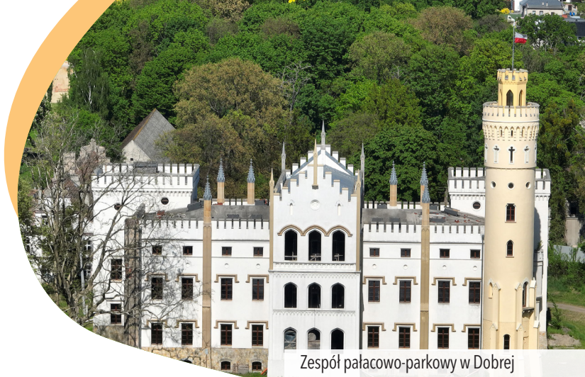
Zespół pałacowo-parkowy w Dobrej