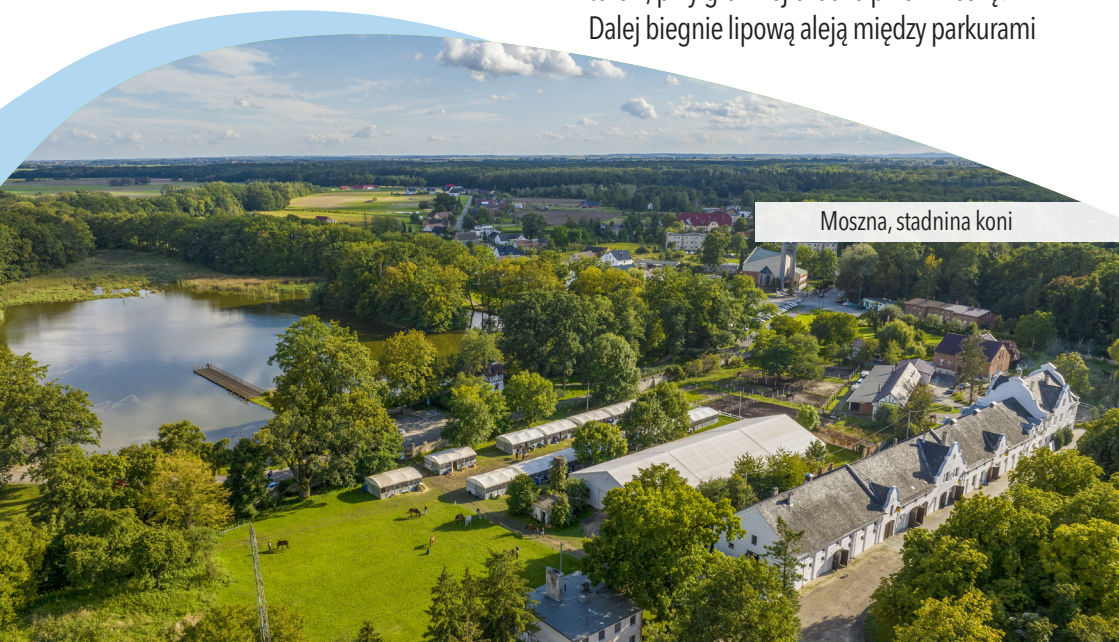
Moszna, stadnina koni

cesarz Wilhelm II i oniemiały zapytał właściciela, jak udało mu się tak szybko zbudować tak piękną siedzibę. Ten odparł, że pomógł mu w tym diabeł. Co ciekawe, mieszkańcy Mosznej już od dawna powtarzali, że wyjątkowe powodzenie oraz bogactwo von Thiele-Wincklerów jest efektem paktu z diabłem. Przekorny hrabia na skutek tych plotek postanowił postawić diabłu pomnik. Stał on przy pałacu jeszcze do II wojny światowej. Zamek składa się z trzech części: centralnej, neobarokowej i dwóch bocznych, z których jedna ma charakter neogotycki. Jest w nim 365 pomieszczeń, w tym: biblioteka, sala balowa, pełna roślin oranżeria oraz kaplica, w której odbywają się koncerty muzyki klasycznej i inne wydarzenia kulturalne. Wnętrza można zwiedzać z przewodnikiem. Warto tu przyjechać na przełomie kwietnia i maja, podczas Muzycznego Święta Kwitnących Azalii. Park wygląda wtedy zjawiskowo, bo oprócz azalii kwitną również rododendrony. Centralna oś pałacowego parku zaczyna się posągami dwóch gladiatorów, przy głównej drodze przez wioskę. Dalej biegnie lipową aleją między parkurami