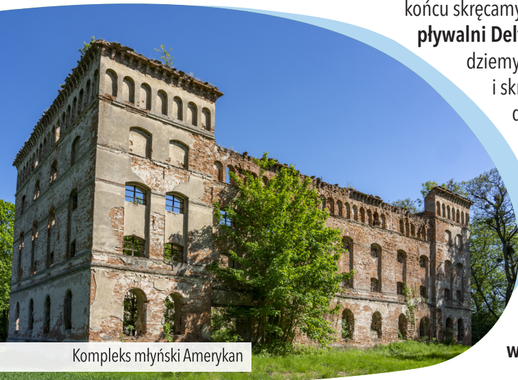
Kompleks młyński Amerykan

za Nowym Młynem , na skrzyżowaniu polnych dróg skręcamy w lewo i przejeżdżamy przez mostek na Osobłodze , docierając na skraj Stebłowa . Tu opuszczamy niebieski szlak i jedziemy prosto czerwonym szlakiem rowerowym , który zaraz za skrzyżowaniem zakręca w prawo. Jedziemy szutrową drogą wzdłuż ogrodzenia strzelnicy . Na rozwidleniu za nią skręcamy w lewo i poruszamy się zadrzewioną aleją na skraju lasu . Na jej końcu skręcamy w lewo i docieramy do plywalni Delfin w Krapkowicach . Jedziemy prosto do końca ul. Azalii i skręcamy w prawo, jadąc dalej ciągiem pieszo-rowerowym wzdłuż ruchliwej ul. Prudnickiej . Przejeżdżamy prosto przez rondo , mijamy stację benzynową i po chwili docieramy do centrum Krapkowic , gdzie kończymy wycieczkę przy wieży Bramy Górnej .