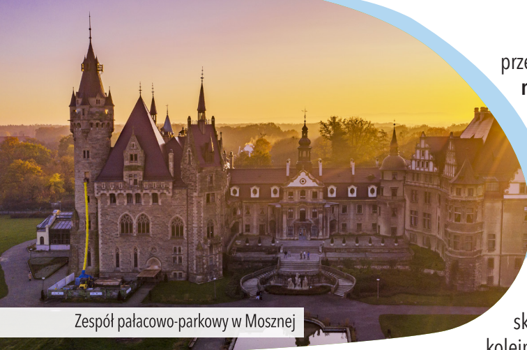
Zespół pałacowo-parkowy w Mosznej

kilka zabudowań położonych przy polanie. Jadąc wciąż niebieskim szlakiem , na kolejnym skrzyżowaniu leśnych dróg skręcamy łagodnie w lewo. Kilometr dalej, na drugim skrzyżowaniu leśnym skręcamy w lewo i po chwili wyjeżdżamy z lasu obok leśniczówki . Trzymając się asfaltowej szosy, dojeżdżamy skrajem lasu do centrum Raławiczek . Przejeżdżamy przez całą wioskę główną ulicą i gdy zakręca ona w lewo, my jedziemy prosto zgodnie z niebieskim szlakiem rowerowym . Po chwili okrążamy duże gospodarstwo rolne. Na jego tyłach skręcamy w lewo (na południe) i jedziemy dalej pośród malowniczych łąk. Tuż za wioską