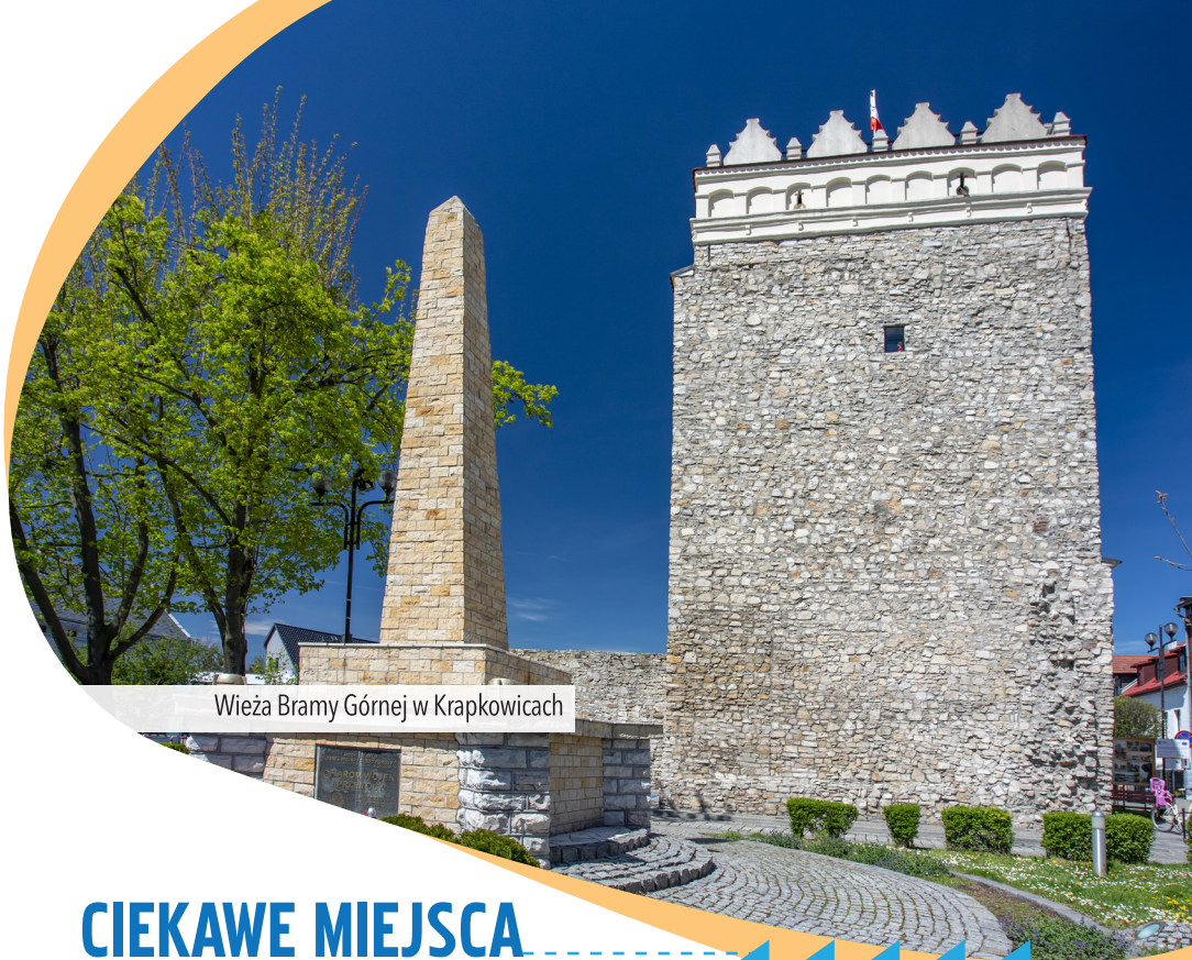
Wieża Bramy Górnej w Krapkowicach