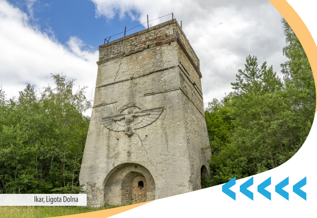
Ikar, Ligota Dolna