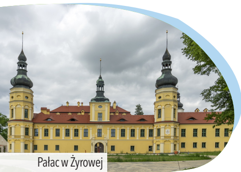
Pałac w Żyrowej

zagospodarowany staw z niewielkim mołem . Za stawem ul. Wojska Polskiego zakręca w lewo. Na następnym rozwidleniu kierujemy się prosto zielonym szlakiem rowerowym (ul. Leśna) . Jedziemy 1,5 km połą drogą z piękną panoramą Góry Świętej Anny . Przecinamy drogę ze Zdzieszowic do Góry Świętej Anny i dalej poruszamy się prosto zielonym szlakiem . 2 km dalej dojeżdżamy do Leśnicy . Jedziemy prosto ul. Żyrowską , a potem ul. Zdzieszowicką . Za zakrętem w lewo wjeżdżamy na ul. Kościelną i docieramy do Rynku .