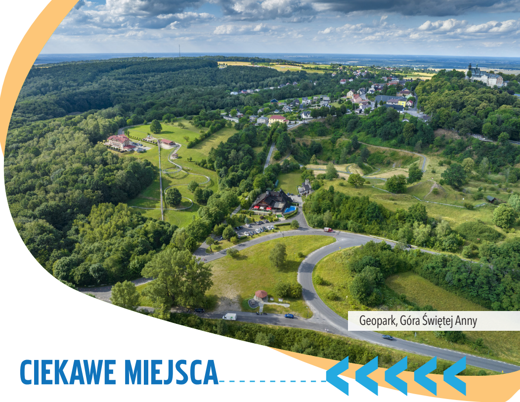
Geopark, Góra Świętej Anny