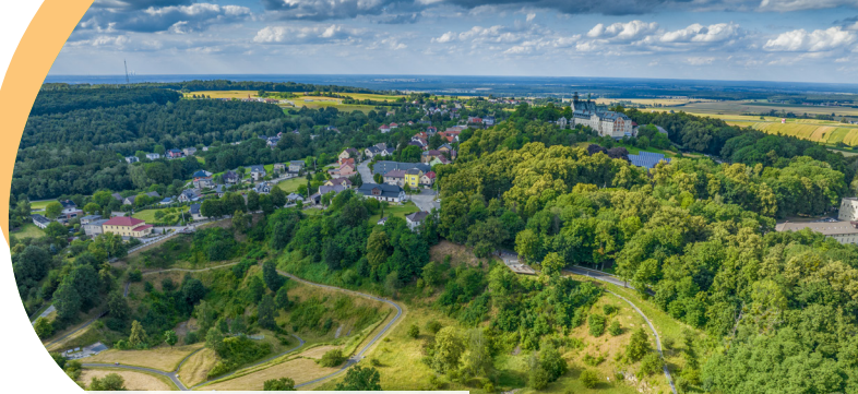
Panorama Góry św. Anny