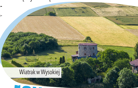
Wiatrak w Wysokiej

i rozległą polanę z ołtarzem papieskim . Za ostatnią z kapliczek dojeżdżamy do stromego wzgórza, na którym stoi bazylika św. Anny . Objeżdżamy ją prawą stroną, ul. Kalwaryjską , na końcu której docieramy do Rynku , gdzie kończymy naszą wycieczkę.