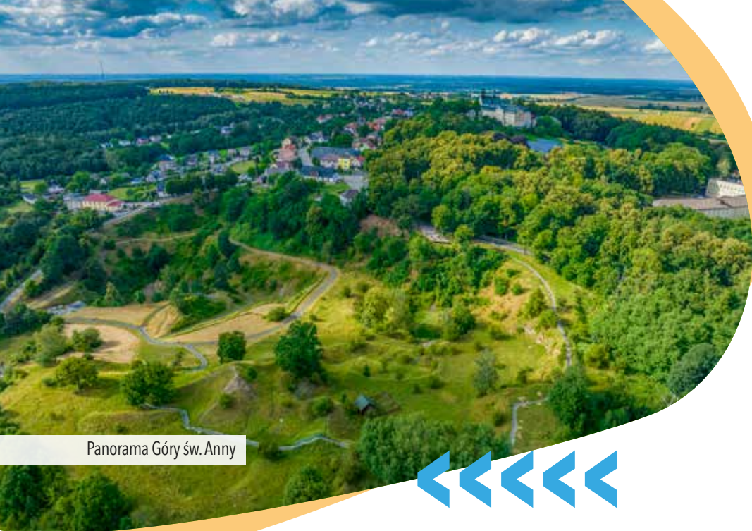
Panorama Góry św. Anny