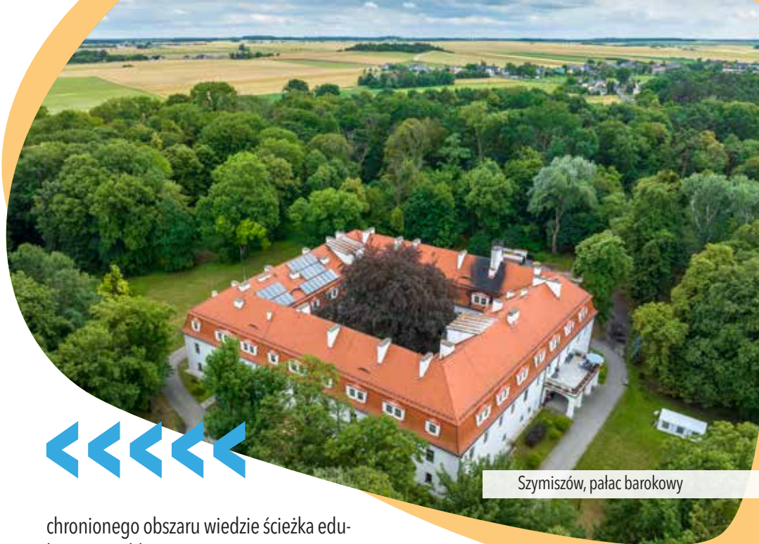
Szymiszów, pałac barokowy

chronionego obszaru wiedzie ścieżka edukacyjna z tablicami opisującymi proces tworzenia się wulkanów. Są tu także 2 punkty widokowe z ławkami ulokowane na stromej skarpie.