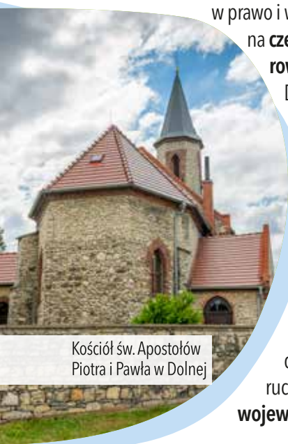
Kościół św. Apostołów Piotra i Pawła w Dolnej

Jedziemy malowniczo falującym raz w górę, raz w dół traktem głównym ok. 1,3 km. Na dużym skrzyżowaniu dróg leśnych skręcamy w prawo. Mijamy grób powstańców śląskich z prawej strony drogi i zjeżdżamy malowniczym wąwozem, którym biegną pieше szlaki (zielony i żółty) do Czarnocina-Granic . W wiosce skręcamy w prawo, na główną ulicę i jedziemy do centrum, gdzie skręcamy w lewo, w ul. Wiejską . Od tej pory poruszamy się żółtym szlakiem rowerowym , który zaraz za wioską skręca w lewo i od razu na następnym skrzyżowaniu w prawo. Jedziemy do końca i skręcamy zgodnie z żółtym szlakiem w lewo, wjeżdżając do górnjej części Poręby i wracając na trasę główną wycieczki.