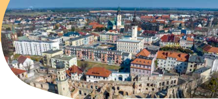
Panorama Strzelce Opolskich