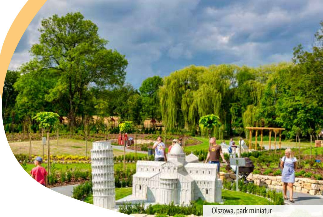
Olszowa, park miniatur