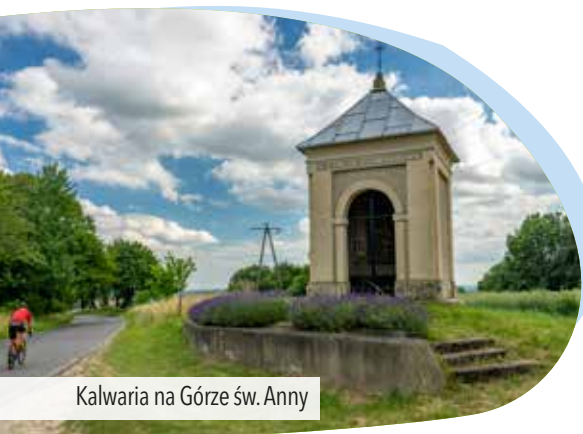
Kalwaria na Górze św. Anny

wiaduktem nad autostradą wjeżdżamy do Wysokiej , gdzie warto na chwilę skręcić w lewo, by zobaczyć stojący nieopodal drogi zabytkowy wiatrak . W Wysokiej czeka nas długi zjazd w kierunku Kalinowa . W centrum wsi mijamy zabytkowy kościół św. Floriana . Na końcu długiego zjazdu docieramy do dość ruchliwej drogi wojewódzkiej nr 409 , skręcamy w prawo i wjeżdżamy do Kalinowa . 800 m dalej, za wioską skręcamy w lewo. Jedziemy niecałe 3 km przez las i tuż przed przejazdem kolejowym skręcamy w prawo, wjeżdżając