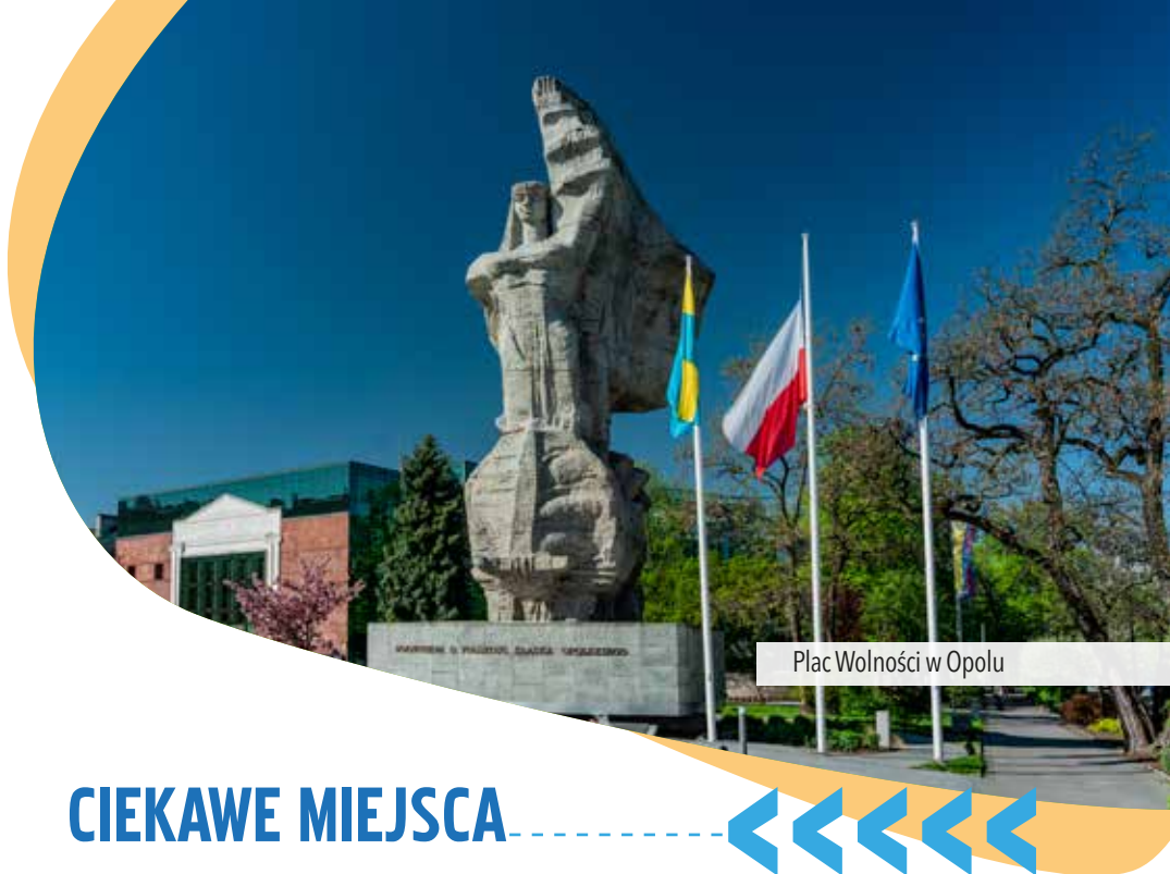
Plac Wolności w Opolu