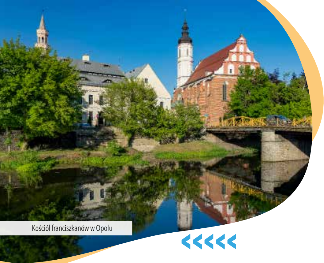
Kościół franciszkanów w Opolu

względu na przyległy do niego klasztor. Franciszkanów sprowadził do Opolu książę Władysław I Opolski w 1238 r. 10 lat później rozpoczęto budowę kościoła. Budynek na zewnątrz utrzymany jest w stylu gotyckim z wyjątkiem wieży nadbudowanej w 1899 r. Wnętrza z kolei mają styl barokowy. W podziemiach kościoła znajdują się udostępnione do zwiedzania krypty Piastów Śląskich, przez co uważany jest on za piastowskie mauzoleum. Klasztor funkcjonuje prężnie do dziś. Zakonnicy co roku organizują Jarmark Franciszkański, na którym oprócz pamiątek czy regionalnych wyrobów spożywczych można kupić balsamy ziołowe