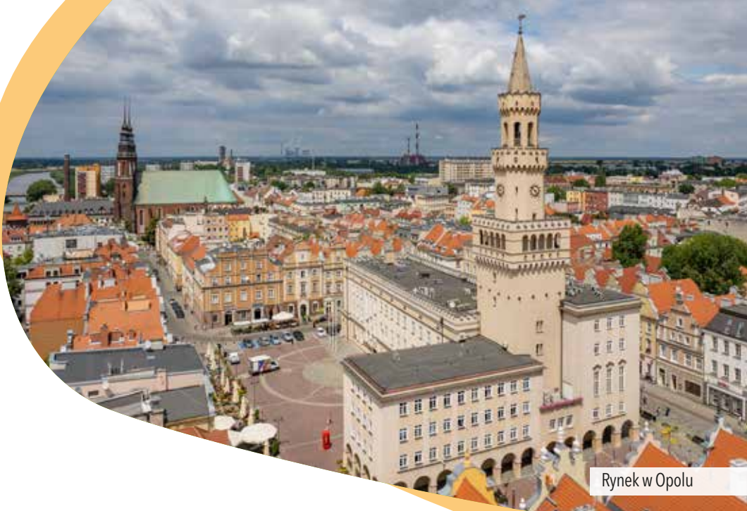
Rynek w Opolu