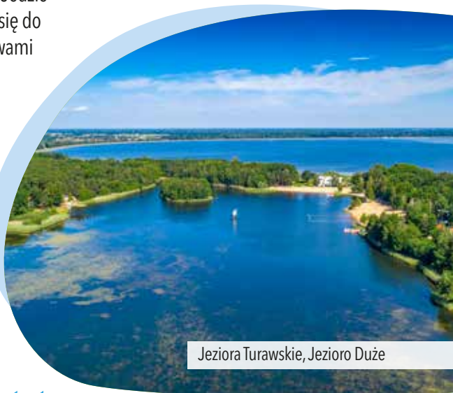
Jeziora Turawskie, Jezioro Duże

lasu aż do drogi technicznej przy obwodnicy Opola . Skręcamy w lewo i jedziemy tak długo, aż zobaczymy przejazd pod obwodnicą, którym przejeżdżamy na drugą stronę i zawracamy w kierunku Centrum Handlowego Turawa Park . Do centrum miasta jedziemy tą samą drogą, którą pokonaliśmy na początku wycieczki. Z centrum handlowego jedziemy al. Witosa do jej końca. Skręcamy w lewo i jedziemy drogą dla rowerów po lewej (południowej) stronie ulicy. Na skrzyżowaniu za pływalnią skręcamy w lewo, w ul. Katowicką , a na następnym skrzyżowaniu w prawo, w ul. Kościuszki . Jedziemy do jej końca drogą dla rowerów, na deptaku przy ul. Krakowskiej skręcamy w prawo i przez pl. Wolności wracamy do Rynku , gdzie kończymy wycieczkę.